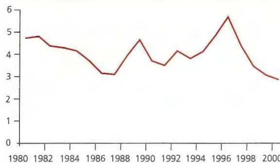
PRECIOS INTERNACIONALES DEL TRIGO, 1980-2000 (DÓLARES POR BUSHEL)