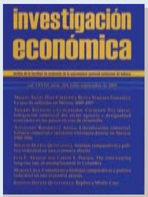
Investigación Económica, vol. LXVIII, núm. 269, julio-septiembre de 2009

El tercer número del año de la revista Investigación Económica ofrece diversos artículos con un enfoque econométrico que permiten avanzar en la comprensión de fenómenos tan importantes como la inflación y la liberalización comercial.